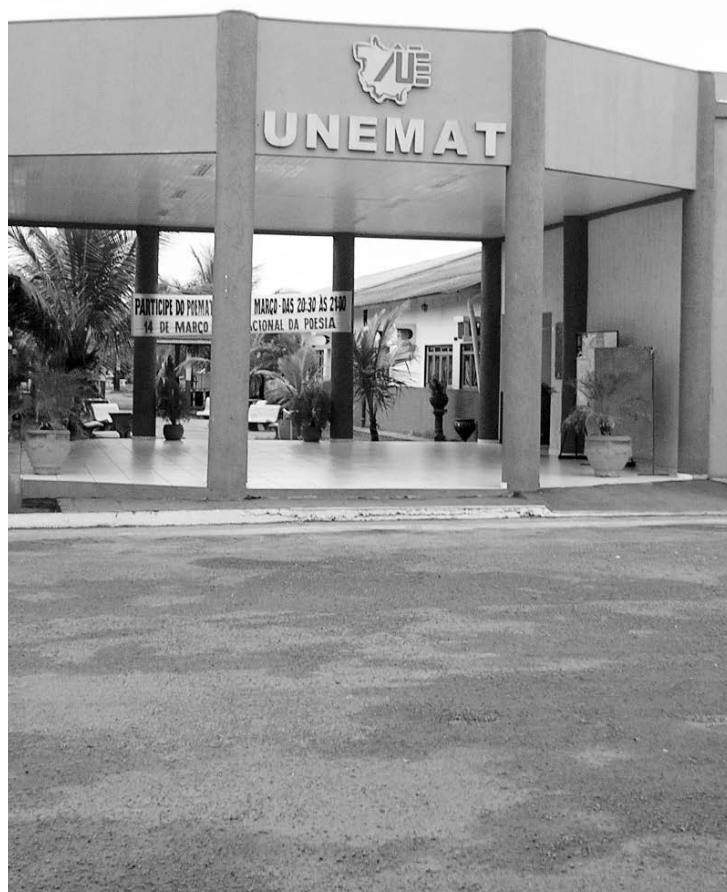
Solenidade acontecerá no câmpus de Tangará da Serra