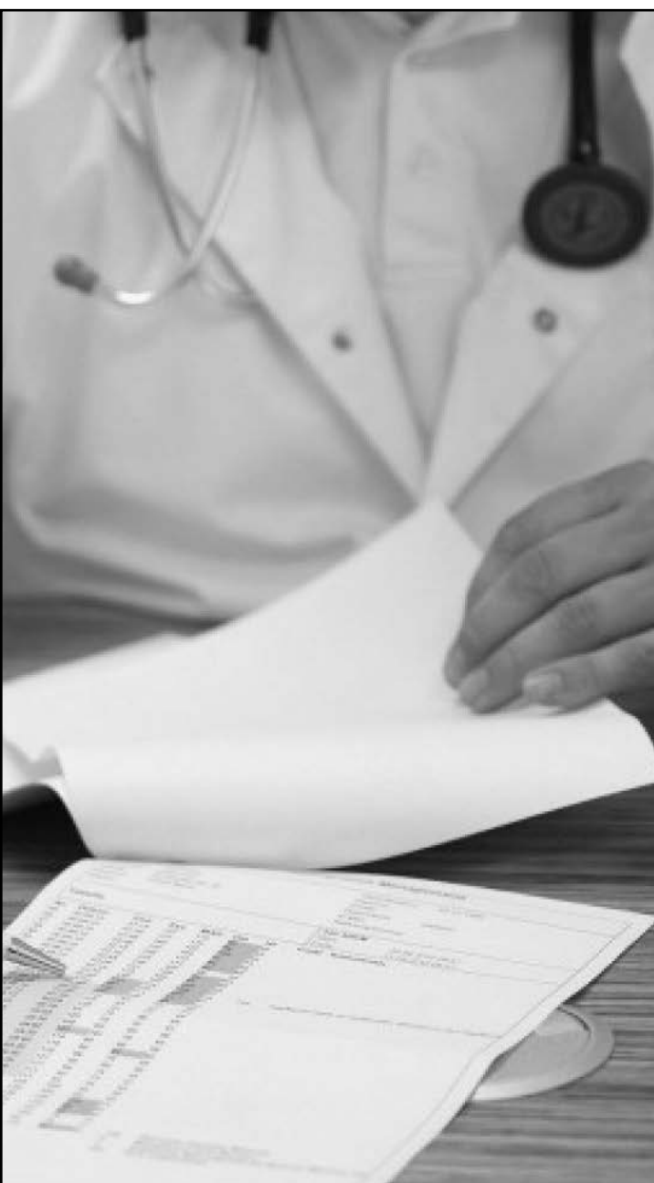
Atendimentos foram replanejados nas USF's