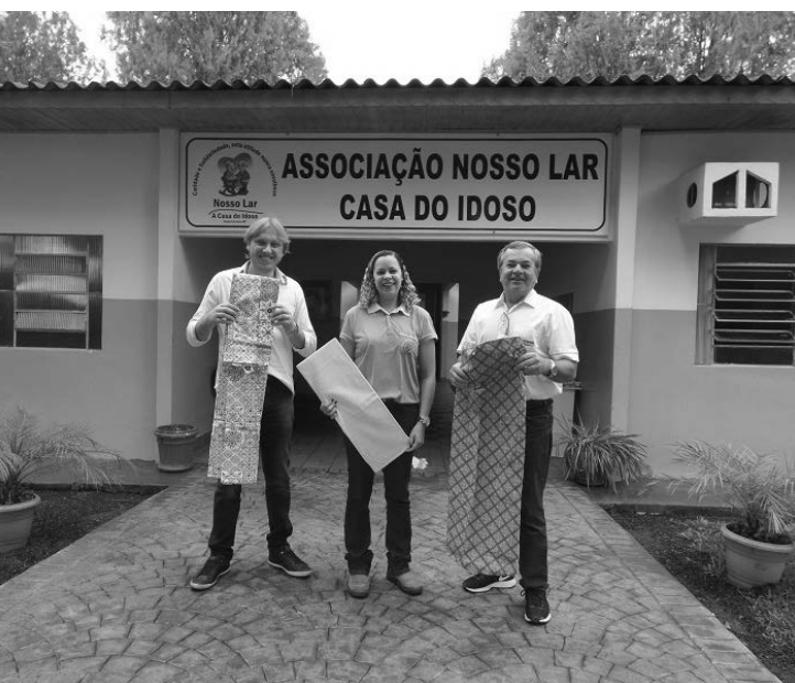
Material foi entregue na manhã desta quarta-feira