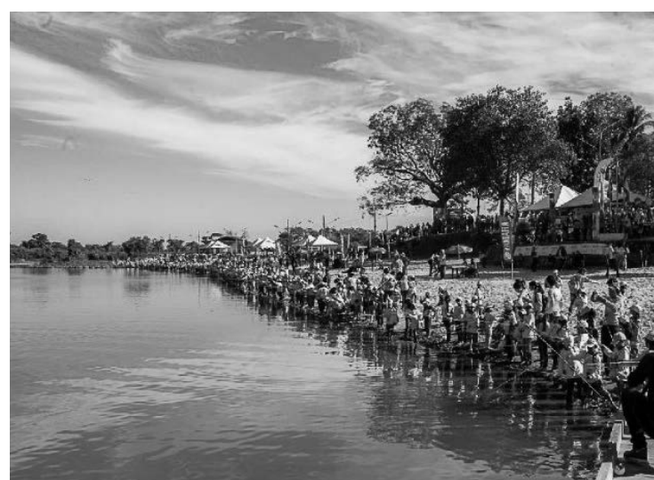
Mais de 150 mil pessoas acompanharam o festival