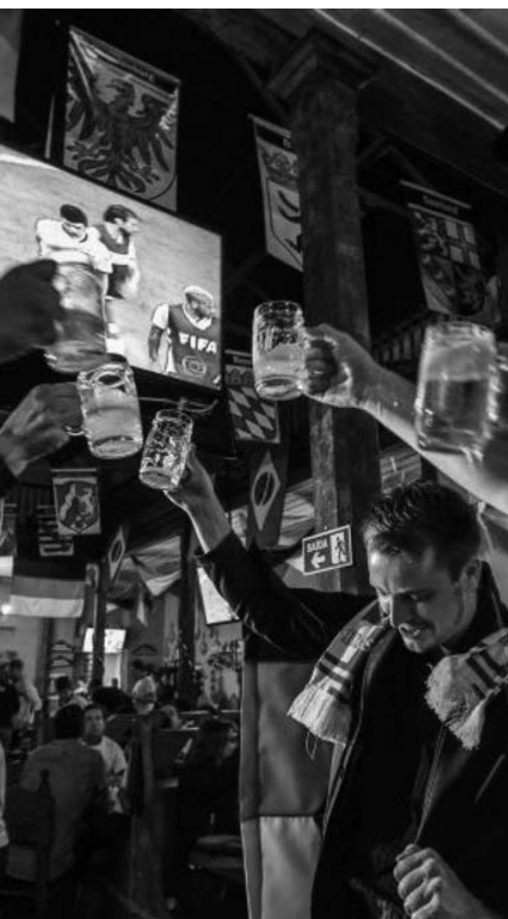
Comércio se preparou para receber consumidores