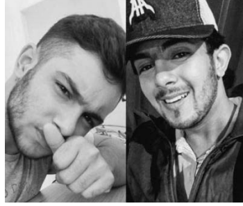
Suspeitos foram detidos

As informações são de que dois adolescentes, de 15 e 16 anos, vizinhos das vítimas, teriam invadido a casa e rendido cinco pessoas. Os pais dos jovens também foram rendidos, mas não chegaram a ficar feridos. Eles tiveram as mãos amarradas para trás. A Polícia Militar foi acionada. No local, os policiais perceberam que havia uma movimentação na residência no fundo do comércio.