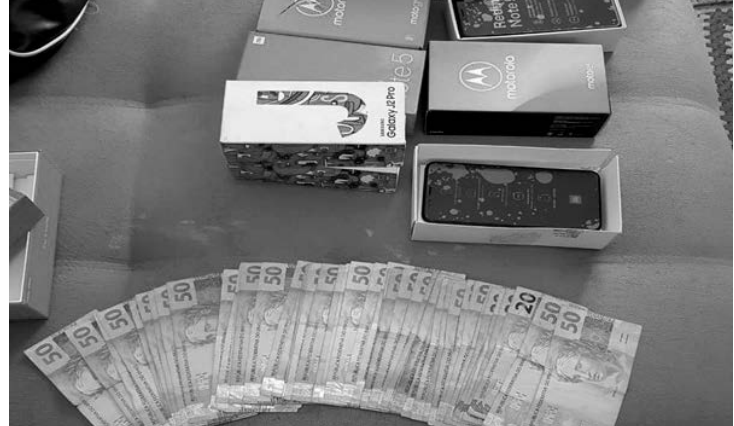
A operação “Red Money” mobilizou 520 policiais civis

A operação, denominada “Red Money”, é coor-