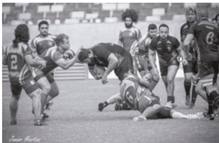
Os atletas retomam a rotina de treinos

“Estamos bem confiantes e animados com 2019. A diretoria do clube foi renovada, assim como o time que está passando por um processo de renovação e inclusão da categoria de base. Estamos trabalhando para aumentar a captação de atletas e difundir ainda mais esse